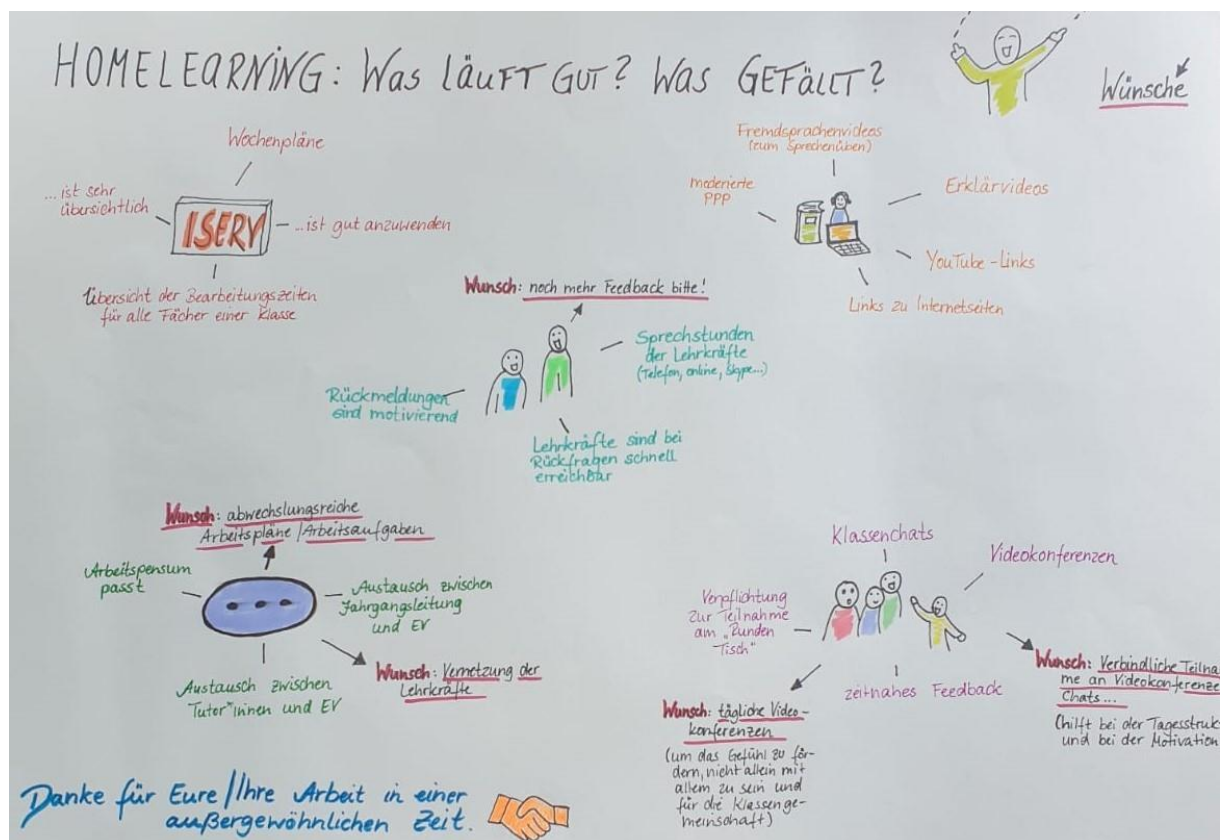
Plakat zur Präsentation Homelearning anlässlich der Schulleiternratssitzung

Gibt es doch mal ein schwerwiegendes Problem und der Fachlehrer reagiert nicht, ist es empfehlenswert, sich an den Tutor, dann die Jahrgangseitung und danach ggf. an die Schulleitung zu wenden.